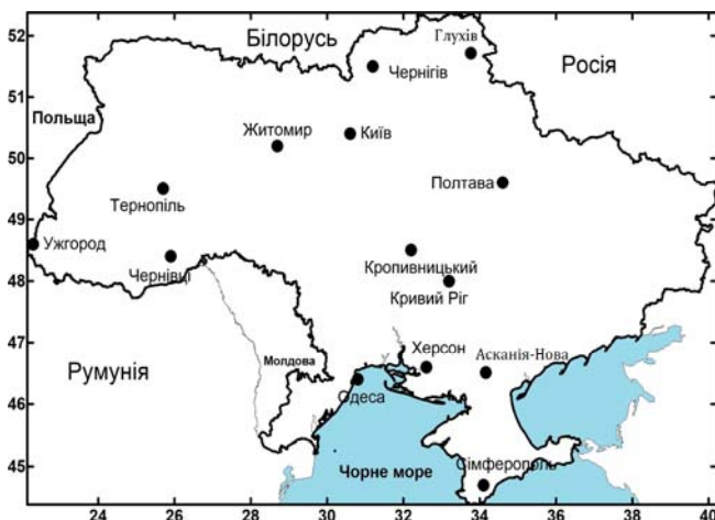
Рис. 1 – Схема розташування метеостанцій

До станцій, розташованих у зоні Полісся (рис. 1), відносяться: Житомир, Київ, Чернігів. У Лісостеповій зоні – Глухів, Кропивницький, Полтава, Тернопіль. Станції, розташовані у зоні